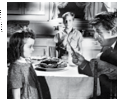
U.S.A. - 1956 - Noir&Blanc - 1h33 Avec Robert Mitchum, Shelley Winters, Lillian Gish. Version originale sous-titrée français

Un prêcheur inquiétant poursuit dans l'Amérique rurale deux enfants dont le père vient d'être condamné pour vol et meurtre. Avant son incarcération, le père leur avait confié dix mille dollars, dont ils ne doivent révéler l'existence à personne. Pourchassés sans pitié par ce pasteur psychopathe et abandonnés à eux-mêmes, les enfants se lancent sur les routes.