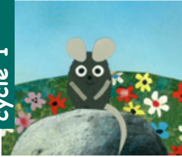
Programme de 5 courts métrages Adaptation de 5 histoires de Leo Lionni. Suisse - 1979 - Couleurs - 30 mn Animation.