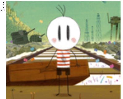
Brésil - 2013 - Couleurs - 1h19 Animation Sans parole

À la recherche de son père, un garçon quitte son village et découvre un monde fantastique dominé par des animaux-machines et des êtres étranges. Un voyage lyrique et onirique illustrant avec brio les problèmes du monde moderne.