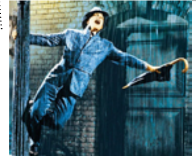
U.S.A. - 1951 - Couleurs - 1h43 Version française Avec Jean Hagen, Gene Kelly, Debbie Reynolds

Don Lockwood et Lina Lemont forment le couple star du cinéma muet à Hollywood. Quand le premier film parlant sort, tous deux doivent s'accommoder et tournent leur premier film du genre. Si Don maîtrise l'exercice, la voix désagréable de Lina menace le duo. Kathy, une chanteuse, est engagée pour doubler la jeune femme mais celle-ci devient un obstacle entre Don et Lina ce qui n'est pas du goût de cette dernière.