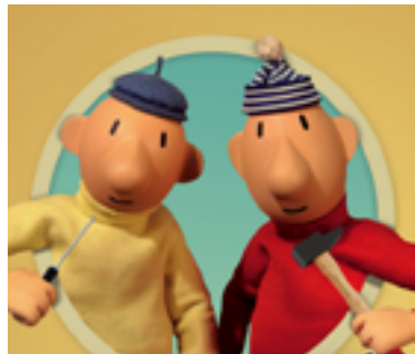
Programme de 5 courts métrages République tchèque 2014 - Couleurs - 40 mn Animation.