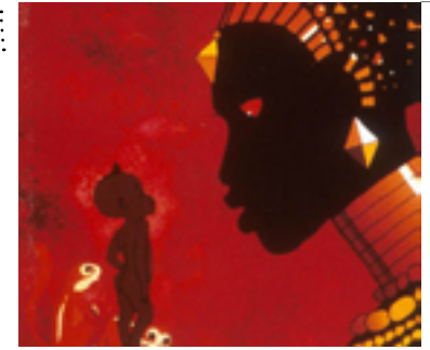
France - 1998 - Couleurs - 1h10 Animation

Le minuscule Kirikou naît dans un village d'Afrique sur lequel une sorcière, Karaba, a jeté un terrible sort : la source est asséchée, les villageois rançonnés, les hommes sont kidnappés et disparaissent mystérieusement. « Elle les mange », soutiennent les villageois dans leur hantise. Karaba est une femme superbe et cruelle, entourée de fétiches soumis et redoutables. Mais Kirikou, sitôt sorti du ventre de sa mère, veut délivrer le village de son emprise maléfique et découvrir le secret de sa méchanceté.